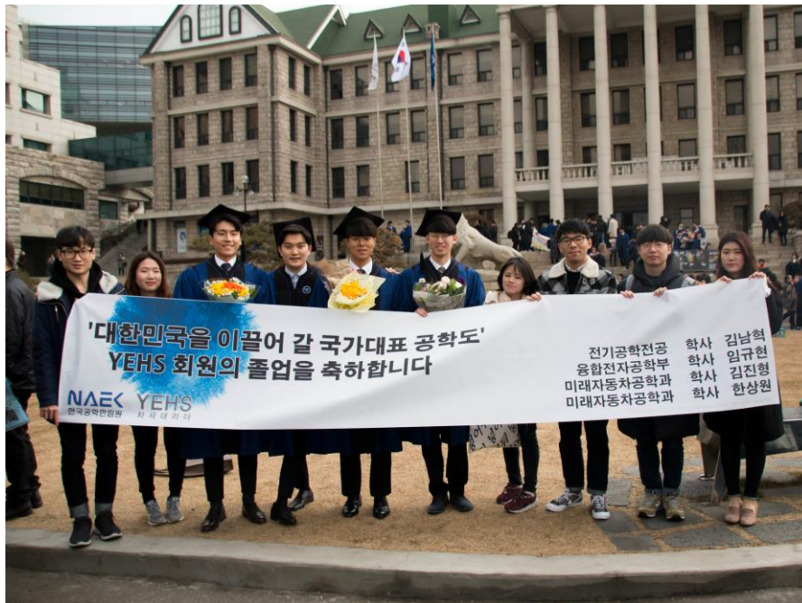
FIGURE 3. 2018 한양대학교 졸업 사진

YEHS 에서는 정회원들을 대상으로 졸업 시 현수막을 걸어 축전을 보내드립니다. YEHS - 한양대에서도 졸업하는 정회원들을 축하하며 학위 수여식에 함께합니다.