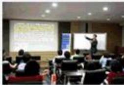
리더십 강좌 연4회