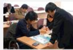
산업체 방문 연2회