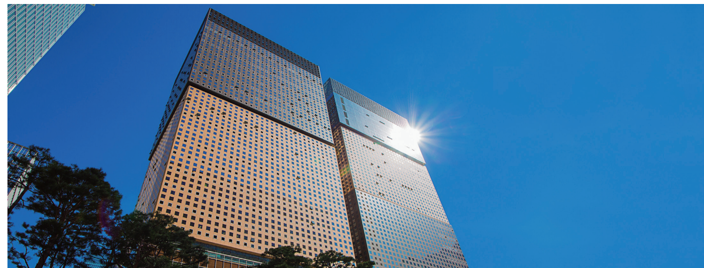
광화문 D타워 Gwanghwamun D Tower