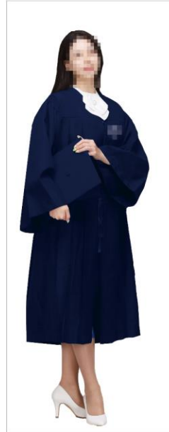
실내프로필 촬영 (20~30분)