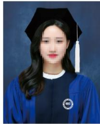
학사모 촬영 (30~40분)