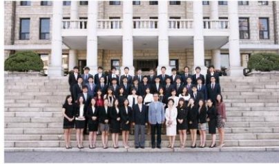
단체사진 (10~15분) 단체촬영을 희망하는 학과는 10월15일~20일 사이 학과대표님이 카카오톡 pusannalla 으로 신청