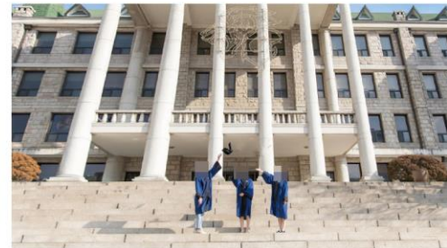
희망자에 한해 우정사진 촬영 (20~30분) 야외 또는 실내 중 선택 하실 수 있습니다. (촬영현장에서 말씀 하시면 됩니다)