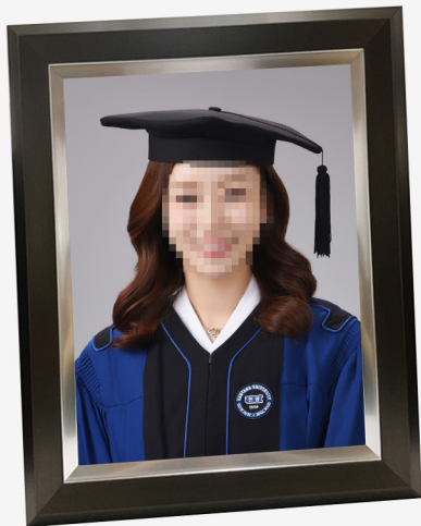
11R 학사복 나무액자(11 X 14 inch)